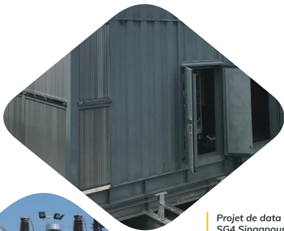
Projet de data center, SG4 Singapour