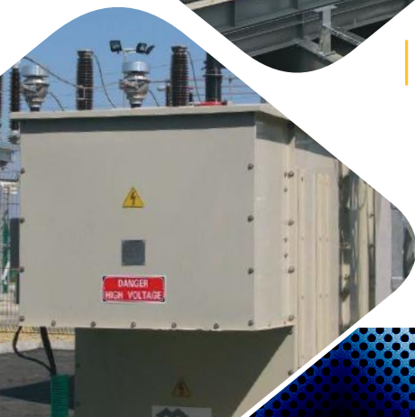
Saint Gobain Romania